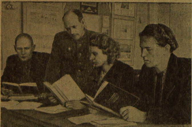
КУИЫШЕВ. На курсах сельских пропагандистов при Куйбышевском обкоме ВКП(б) подготовлено к новому учебному году более 250 руководителей кружков по изучению биографии В. И. Ленина и И. В. Сталина и «Краткого курса истории ВКП(б)».

Для занятий кружка и школы отведены удобные помещения.